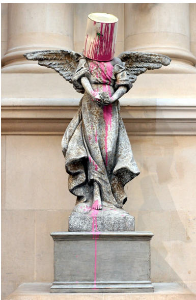
Sculpture de Banksy : ange rose

Il s'emploie à donner vie à des personnages dessinés préalablement en pochoirs. Bien sûr ses œuvres ne s'arrêtent pas uniquement au Street Art. Il réalise aussi des peintures sur canevas et des sculptures avec la même optique : chambouler la conscience collective et frapper fort sur la politique, les faits de société, l'actualité et la guerre.