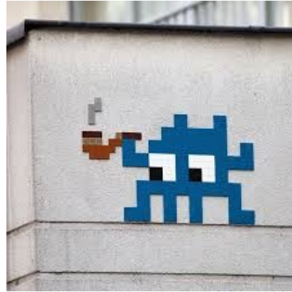
Invader : Pixel Art