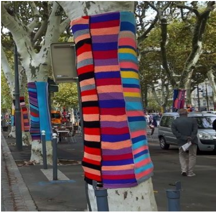
platanes du centre-ville de Béziers, yarn bombing

Le Street art », par contre englobe de nombreux autres médiums et techniques, y compris l'art LED, la mosaïque, la murale, l'art du pochoir, le sticker art, la projection vidéo, les installations de rue et le yarn bombing (art du tricot de rue).