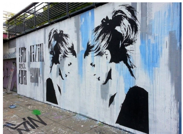
Œuvre au pochoirs de Sin.