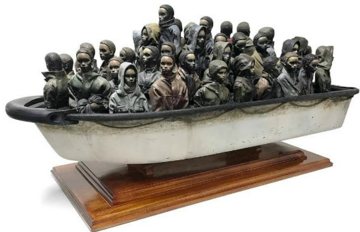
Sculpture de Banksy : Bateau de migrants