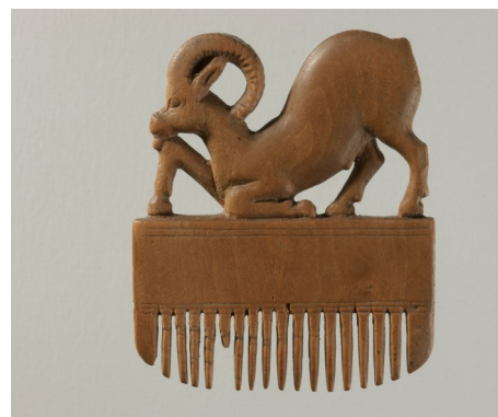
Peigne : bouquetin, un genou à terre : Nouvel Empire, 18e dynastie (1550-1425 av. J.-C.)

Dans un même temps les articles de luxe de haute qualité deviennent de véritables œuvres d'art.