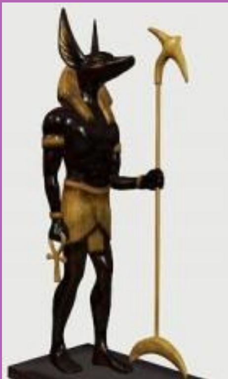
Statuette égyptienne antique représentant Anubis, dieu à tête de chacal