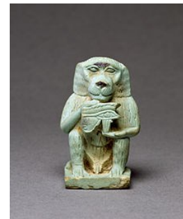
Thot avec l'œil Oudjat dans les mains

La vivacité frappante de certaines amulettes de cette période révèle la vitalité renouvelée de cette tradition.