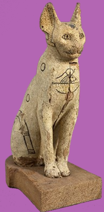
Sarcophage de chat, Musée du Louvre