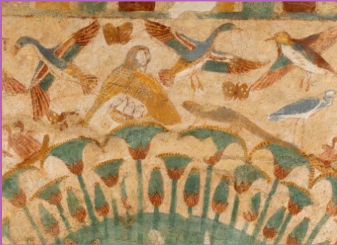
Oiseaux volant dans les marais (détail) Peinture sur limon,

© Musée du Louvre, Dist. RMN-GP / Georges Poncet