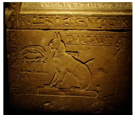
Sarcophage du chat du prince Thoutmosis

Beaucoup de ces bronzes étaient aussi des conteneurs pour les reliques de corps d'animaux réels.