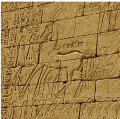
Bas-relief sculpté sur un mur du temple de Medinet Habou

La deuxième phase de la représentation des animaux a commencé lors de la 4ème Dynastie et a atteint son paroxysme lors de la 5ème.