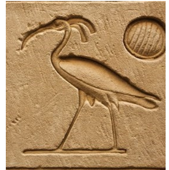
Ibis, Hiéroglyphe gravé sur le temple d'Horus

Beaucoup d'images de divinités importantes représentées sous des formes animales ont commencé à recevoir leur forme définitive, un processus achevé sous la 3ème dynastie..